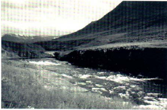
Fnjóská í Dalsmynni.