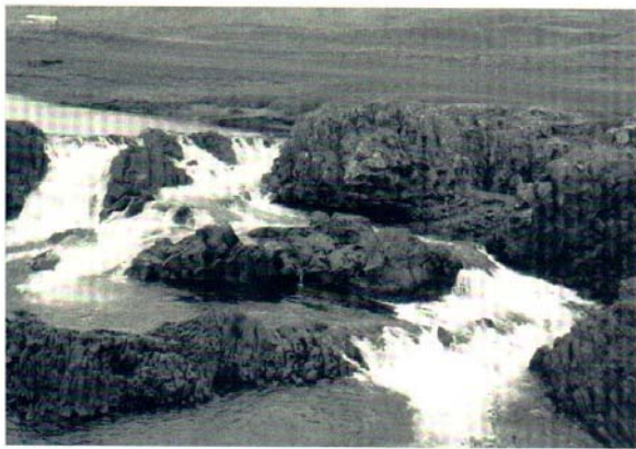
Fossinn Glanni í Norðurá í Borgarfirði.

Fullyrða má, að grundvöll þessarar hagstæðu þróunar megi þakka setningu lax- og silungsveiðilaganna 1932. Sú félagslega uppbygging með stofnun og starfsemi veiðifélaga, sem veiðilögin gerðu ráð fyrir meðal annars, er tvímælalaust