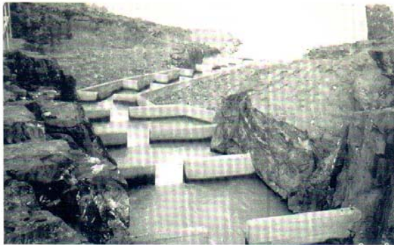
Laxastigi hjá Lagarfossi, neðsti hluti.

Þá hefur ýmislegt athyglisvert og spennandi verið að gerast í sambandi við ræktun og nýtingu vatnsvæða til laxveiða. Það nýmæli var tekið upp sem nefnt hefur verið „hafbeit til stangaveiði“ og eru Rangárnar orðnar þekktastar fyrir þá aðferð, sem skilað hefur metlaxaveiði á svæðinu. Í Rangánum hefur lengst af ekki verið um laxveiðihéð að ræða því að sjóbirtingur og bleikja voru þar nær allsráðandi en vottur var þar af laxi. Þeir fiskstofnar höfðu fyrr á árum orðið fyrir þungum búsigfum vegna umbrota í Heklu og má sérstaklega nefna gosið 1947 sem hófst í mars það ár. Það olli verulegu tjóni á svæðinu. Þá barst mikið af ýmsum gosefnum, eins og vikri í Eystri-