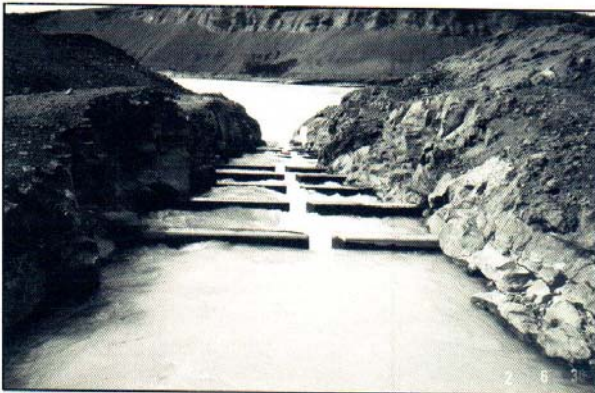
Einn nýjasti laxastiginn, fiskvegurinn í Búðafossi í Þjórsá. (Ljóm. E.H.).