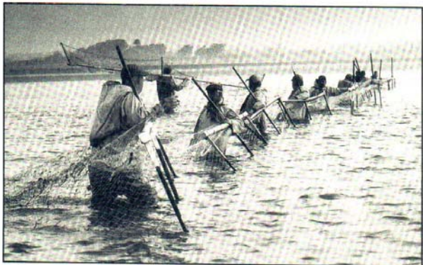
Laxveiðar í sjó við strönd Skotlands.