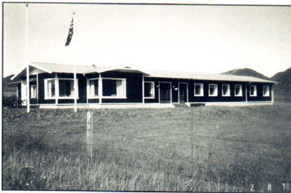
Veiðihúsið Flóðvangur við Vatnsdalsá.

Að síðustu má nefna, að verðmæti stangarveidds lax er auðvitað margfalt meira en fisks, sem veiðdur er í net eða á línu á fæðustöðvunum í hafinu og er ekki búinn að ná endanlegri þyngd. Stangaveiðin skilar beint miklum tekjum, og auk þess góðum tekjum í formi afnota veiðimanns af veiðihúsi, og ferðþjónustan nýtur auk þess tekna af ferða- og upphaldskostnaði hans til og frá veiðistað og á veiðistað og fleiru. Þjóðhagslega séð er þetta því hið besta mál.