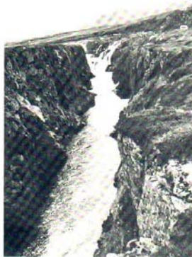
Sandárfoss í Pistilfirði. (Ljós. Einar Hannesson).

Auk fyrrgreindra stöðuvatna mætti telja til nokkur vötn í landshlutanum, sem eru minni en þau vötn sem nefnd hafa verið: Langavatn og Kringluvatn, sem eru á vatnakerfi Mýrarkvíslar, Botnsvatn hjá Húsavík, Arnarneslón í Kelduhverfi og vötn á Melrakkaslétu: Skerjalón, Suðurvötn, Sigurðarstaðavatn, Blikalón, Ytra-Deildarvatn, Deildarvatn og Þernuvatn. Þá má nefna Kollavík-urvatn og Stóra-Viðarvatn og að síðustu Eiðisvatn á Langanesi, að ógleymdu Skjálftavatni í Kelduhverfi, sem myndaðist í jarðskjálftum vegna eldsumbrota á Kröflusvæðinu fyrir nokkrum árum.