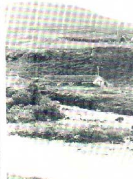
Klakhús hjá Brúnum við Laxá í Pingeyjarsýslu.