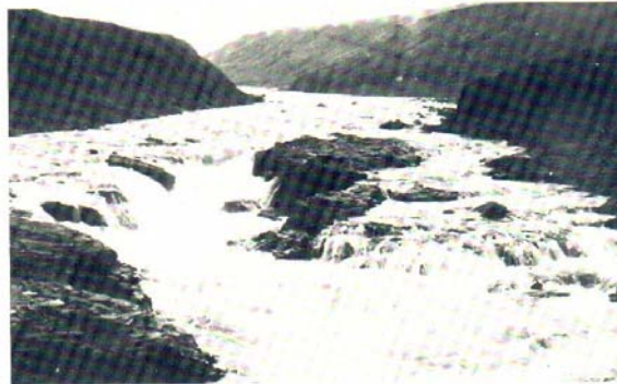
Efri Laufásfossar í Fnjóská.

Í Norðurlandi eystra eru fimm í hópi 14 straumvatna, sem eru með stærst vatnasvið hér á landi. Þetta eru Jökulsá á Fjöllum (1), sem er með mesta vatnasvið allra vatnsfalla á landinu. Jökulsá er 206 km á lengd og vatnasvið hennar 7.750 km 2 , þarf af 1.400 km 2 af jökli. Þá kemur Skjálfandafljót (4) sem er með 3.860 km 2 vatnasvið, 140 km 2 af jökli, en fljótið er 178 km á lengd. Laxá í Aðaldal (10) með 2150 km 2 vatnasvið og er 58 km á lengd, Fnjóská (13) 1.310 km 2 vatnasvið og er 117 km á lengd og Eyjafjarðará (14) með 1.300 km 2