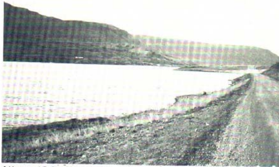
Ljósavatn í Suður-Pingeyjarsýslu. (Ljós. Einar Hannesson).

Silungsrnar eru um 11 talsins. Það eru Hörgá og Svarfaldalsá í Eyjafirði, Ólafsfjarðará, Litlá í Kelduhverfi, árnar í Fjörðum: Austurá og Bakkaá, Dalsá á Flat-eyjardal, Jökulsá á Fjöllum, Brunná og Lónsós á Langanesi. Svipað má segja um silungsrnar og laxárnar. Þær eru yfirleitt leigðar út til stangveiði. Netaveiði fyrir göngusilung fer fram í sjó að einhverju marki og einnig í stöðuvötnum sem hafa rennissamband við sjó, eins og t.d. sum vötnin á Melrakkaslétu og lónin í Kelduhverfi. Það er fyrst og fremst sjó bleikja sem veiðist í ánum, en lax