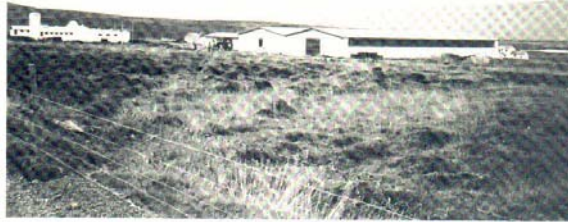
Laxeldisstöð Norðurlax hf. á Laxamýri. (Ljós. Einar Hannesson).

Í Norðurlandi eystra eru 20 veiðifélög starfandi með 681 jörð innan sinna vébanda. Enn á eftir að stofna nokkur félög við ár og vötn og í landshlutanum, áður en fullnægt er ákvæði laga um lax- og silungsveiði frá 1970 um þá skyldu að hafa veiðifélög um allar ár og vötn í landinu. Veiðifélögin hafa beitt sér fyrir, auk útleigu áнна, fiskrækt, sem fyrr er getið um. Þá